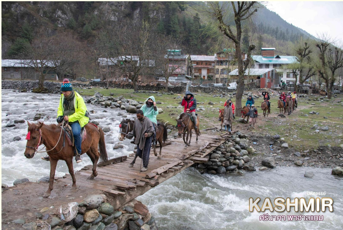
บรีสจอร์จ KASHMIR ศรีนาคา พาชาลาม

จากนั้น เย็น จากนั้น นำท่านเดินทางกลับสู่เมืองศรีนาคา ๓๑ บริการอาหารเย็น ณ ที่พัก HOUSEBOAT พักที่ Houseboat หรือเทียบเท่า มาตรฐาน เมืองศรีนาคา (โรงแรมที่ระบุในรายการทัวร์เป็น เพียงโรงแรมที่นำเสนอเบื้องต้นเท่านั้น ซึ่งอาจมีการ เปลี่ยนแปลงแต่โรงแรมที่เข้าพักจะเป็นโรงแรมระดับ เทียบเท่ากัน)