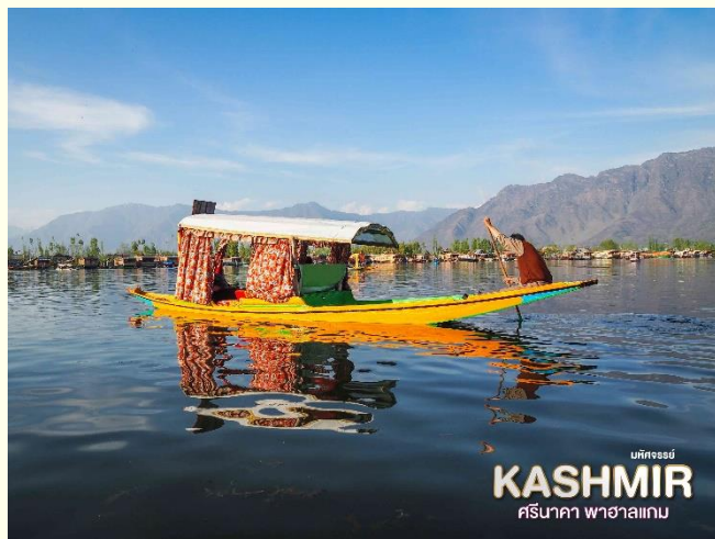
KASHMIR ศรีนาคา พาทัวร์แอม

นำท่านเดินทางกลับสู่ เมืองศรีนาคา เดินทางสู่ ทะเลสาบดาล (Dal Lake) ทะเลสาบที่ใหญ่ที่สุดในรัฐแคชเมียร์ และเป็นทะเลสาบที่มีชื่อเสียงที่สุดในแคชเมียร์ ในตอนเช้าของเมืองนี้จะมีพ่อค้าแม่ค้า ล่องเรือมาขายเป็นตลาดดอกไม้และเป็นวิถีชีวิตในตอนเช้าที่ทะเลสาบดาล พิเศษ!!! นำ