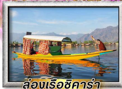
ล่องเรือชิคาร่า