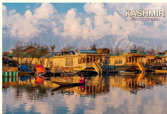
บรีสจอร์จ KASHMIR ศรีนาคา พาชาลาม

จากนั้น เย็น จากนั้น นำท่านเดินทางกลับสู่เมืองศรีนาคา ๓๑ บริการอาหารเย็น ณ ที่พัก HOUSEBOAT พักที่ Houseboat หรือเทียบเท่า มาตรฐาน เมืองศรีนาคา (โรงแรมที่ระบุในรายการทัวร์เป็น เพียงโรงแรมที่นำเสนอเบื้องต้นเท่านั้น ซึ่งอาจมีการ เปลี่ยนแปลงแต่โรงแรมที่เข้าพักจะเป็นโรงแรมระดับ เทียบเท่ากัน)