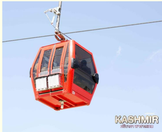
KASHMIR ศรีนาคา พาทัวร์แอม

นำท่านสู่ กุลมาร์ค (Gulmarg) หรือ“แดนทุ่งหญ้าแห่งดอกไม้ (Meadow of Gold)” ด้วยทัศนียภาพที่สวยงามและถือเป็นความงดงามที่มาจากธรรมชาติอย่างแท้จริง สามารถเที่ยวชมได้ทุกฤดู จัดเป็นสถานที่ที่ต้องมาให้ได้สักครั้งในชีวิต นำท่านไปยัง สถานีกุลมาร์ค กอนโดลา ชมเทือกเขากุลมาร์ค นั่งกระเช้าลอยฟ้าที่สูงที่สุดในโลกด้วย